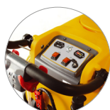
Tableau de commande