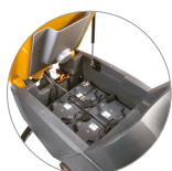
Réservoir de récupération avec ressort à gaz