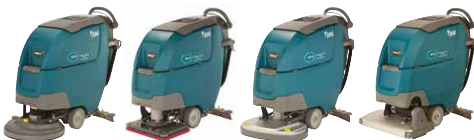
Disque simple : 430 mm et 500 mm

Les autolaveuses T300 sont équipées de multiples types de tête afin de s'adapter à vos besoins de nettoyage et d'optimiser les performances de nettoyage.