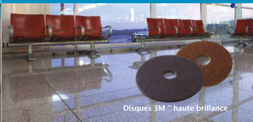
Disques 3M™ haute brillance