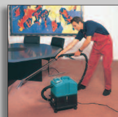
Machine en action